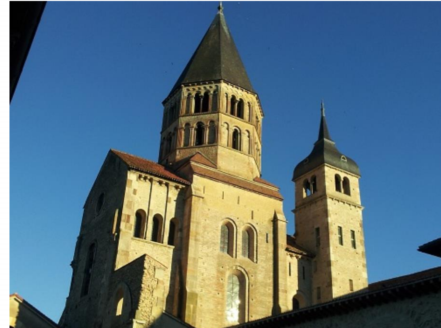
Église abbatiale de Cluny