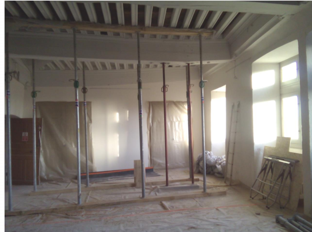
Prieuré de Pommiers – travaux de conservation dans la salle de Justice